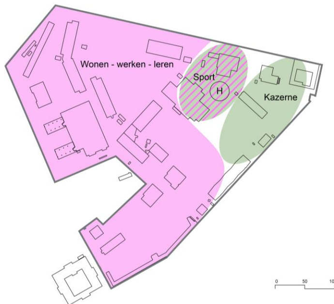
Afbeelding: globale omvang en locatie verschillende functies

De volgende stap is het opstellen van een Nota van Uitgangspunten, waarin de ruimtelijke en programmatische kaders voor het hele Marineterrein verder worden vastgelegd. Deze Nota van Uitgangspunten zal integraal onderdeel uitmaken van de nog op te stellen Projectnota. Uiteraard wordt de door u op de Principenota aangenomen motie 1409 van 8 november 2017, waarin u verzoekt meer ruimte voor wonen en voorzieningen te realiseren, in het proces meegenomen.